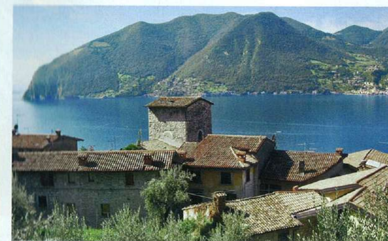
Sopra, il piccolo borgo di Menzino ci accoglie con i suoi stretti viottoli (che ci regalano ombra nelle giornate estive) e la sua spettacolare vista sulla sponda opposta del Lago d'Iseo

raggiungere il paese di Cure per poi proseguire sulla salita in pietra e cemento con pendenze elevate fino al santuario, la fatica viene alleviata dalla stupenda vista del gruppo dell'Adamello che fa da sfondo alle montagne della valle Camonica. Arrivati sulla cima troviamo il santuario arroccato su uno sperone di roccia e una vista a 360 gradi, da qui possiamo osservare i luoghi dove si svolgono due importanti gare di Mtb nazionali: a nord il monte Guglielmo dove ha luogo la Rampigolem e a est il monte Mafa e Iseo, terreno di scontro della "Prestigiosa" Gimondibike che si svolge a Settembre. Ogni 5 anni la statua della madonna del santuario